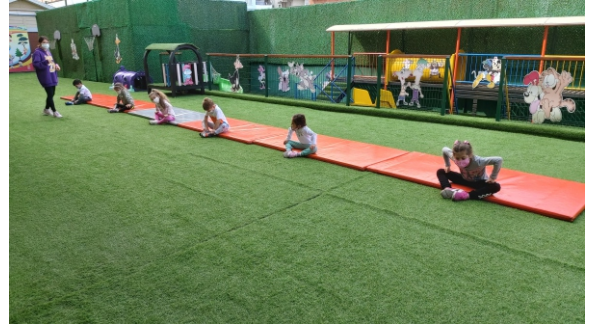
Ayşe SOYDAŞ Beden Eğitimi Öğretmeni